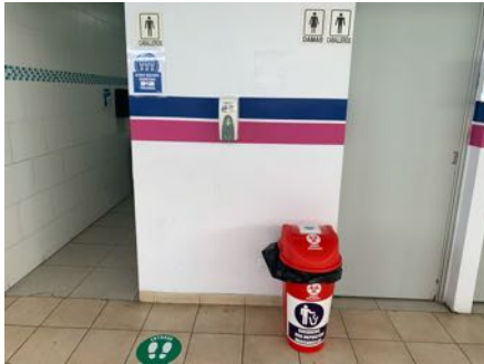
Baños con aforos mínimos. Cestos para desechos de equipos de protección personal.