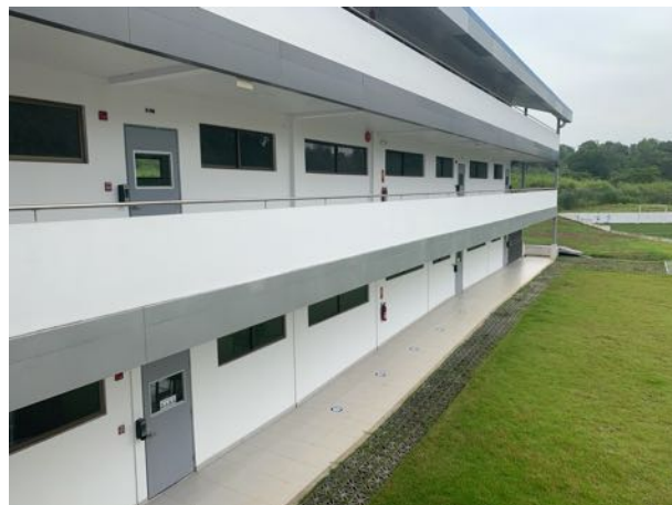
Nueva sede de secundaria, con más salones y más espacio para distanciamiento.