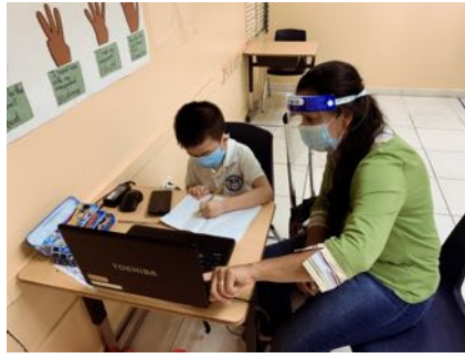
Plan Piloto de tutorías para niños con necesidades de educación especial.