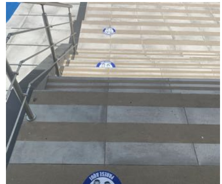
Señalización en pasillos y escaleras