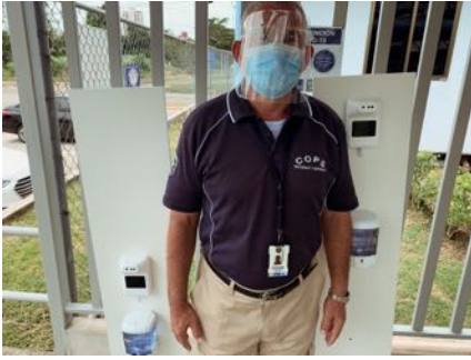
Seguridad -Sistema de medición de temperatura para todas las edades.