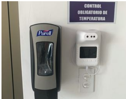
dispensadores de gel en todas los salones de clases.