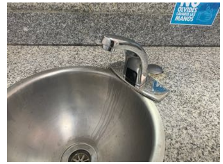
Sistemas de lavamanos automáticos.