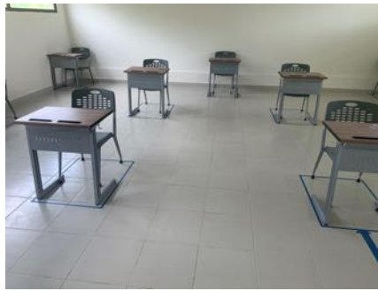
Salones amplios con aforos de hasta 16 estudiantes con marcas autorizadas de distanciamiento entre sillas.